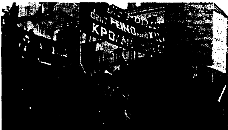
„Polizei dein Feind und Killer!“ Demonstration in München.

Verantwortlicher Redakteur: Ernst Aust; Verlag Ernst Aust, Hamburg. Druck: Würzburger Schnell-Druck. Redaktion: 2 Hamburg 71, Postfach 464; Vertrieb: 87 Würzburg, Postfach 612. Postscheckkonto: Hamburg, Nr. 26 27 67. Erscheinungsweise: alle vierzehn Tage montags; Einzelpreis 50 Pfennig; Abonnement Inland 11.- DM für (26 Ausgaben) einschl. Porto, Ausland 11.- DM für ein Jahr (26 Ausgaben) zuzüglich Porto. Das Abonnement ist für ein Jahr im voraus durch Überweisung auf unser obenstehendes Postscheckkonto zu zahlen.