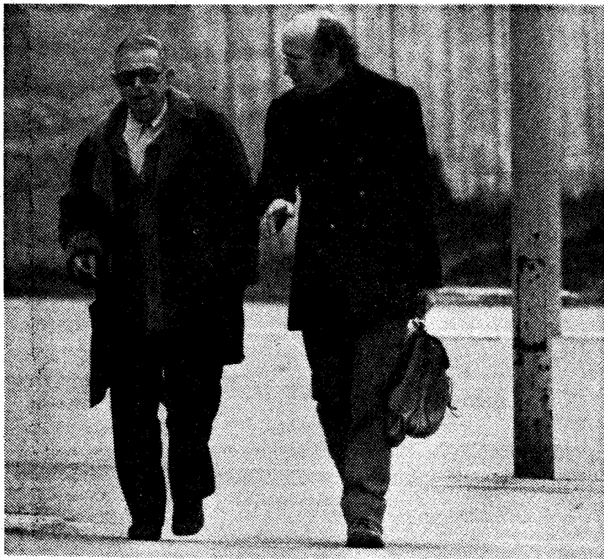
Jean-Paul Sartre, Baader-Anwalt Croissant: Im Zweifel für den Widerspruch