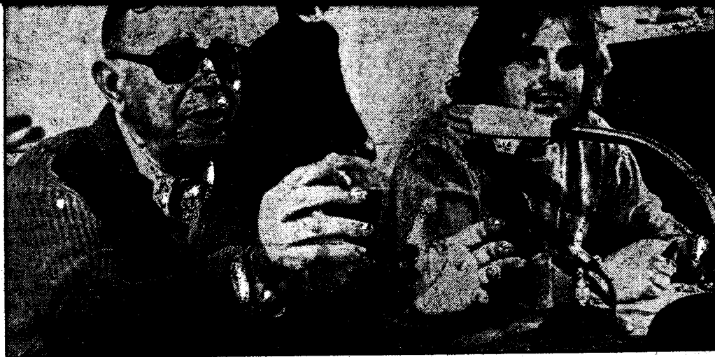
Mit Strickjacke und dunkler Brille: Jean-Paul Sartre. Neben dem Franzosen: der Dolmetscher Daniel Cohn-Bendit, ehemaliger Studenten-Führer.

Eine Viertelstunde für Sartres Fragen, eine Viertelstunde für den zugelassenen Übersetzer, eine Viertelstunde für Andreas Baaders Antworten, eine Viertelstunde für den Übersetzer — das war alles.