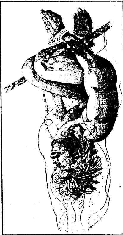
HANGING FROM THE "PARROT'S PERCH"

that threaten the security of the state, especially terrorist extremists. The argument draws some support from the reckless brutality of recent terrorist movements and from the massive Communist threat—at least as it is perceived in many countries. "Nobody wants to be called a torturer," says one senior Argentine officer. "The word stinks of cowardice. But nobody ever gave away important information because a gentleman came up to him and said: 'Please tell me what you know.'"