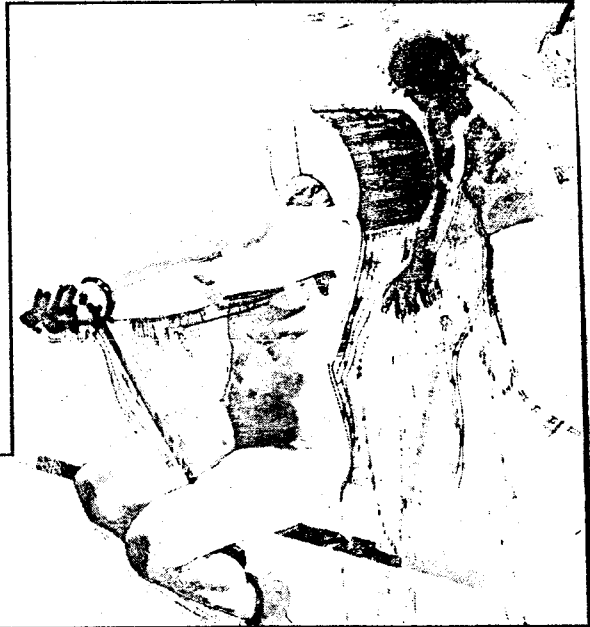
ABOVE: THE HELMET THAT MAGNIFIES SCREAMS; LEFT: THE "DRY SUBMARINE"

► In the Philippines, President Ferdinand Marcos has declared that "no one but no one has been tortured." An investigation by the Association of Ma-