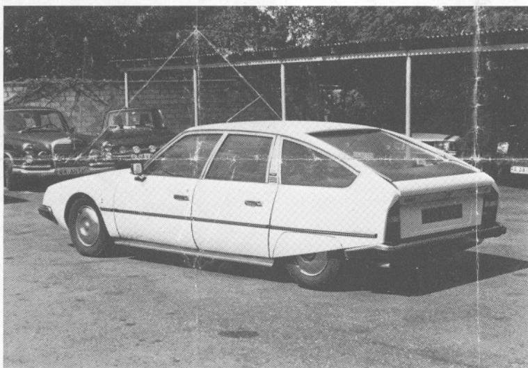
Citroen CX 2400 Pallas, franz. Kennzeichen 686 KG 76

Im Fahrzeug lag ein braun-rotes Zweimannzelt