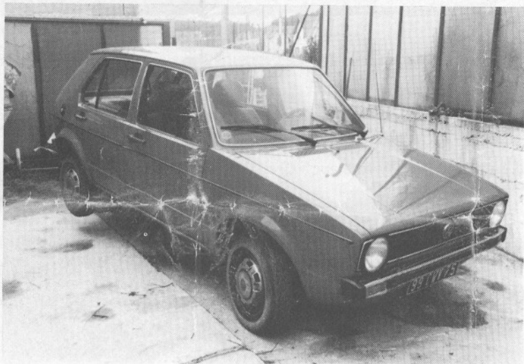
VW-Golf Diesel, franz. Kennzeichen 99 CWV 75

Terroristische Gewalttäter haben in letzter Zeit überwiegend Kraftfahrzeuge mit französischen Kennzeichen, unter anderem die unten abgebildeten Fahrzeuge (eventuell mit wechselnden Kennzeichen) benutzt.