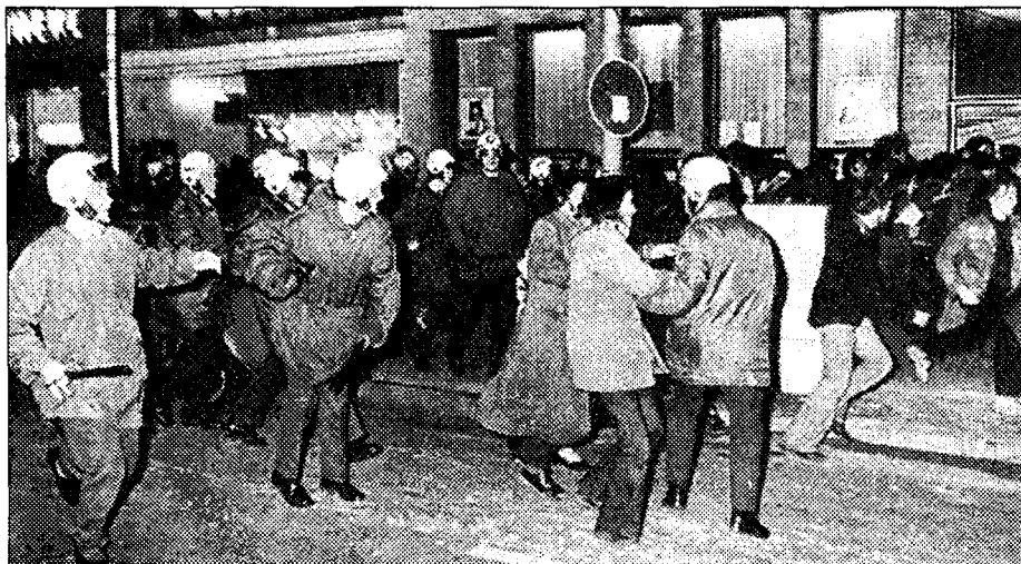
In vielen Städten - hier Berlin - fanden am 10. November 1974 Protestdemonstrationen gegen den Tod von Holger Meins statt.

Wie das ausgegangen ist, ist ja bekannt. 1977.