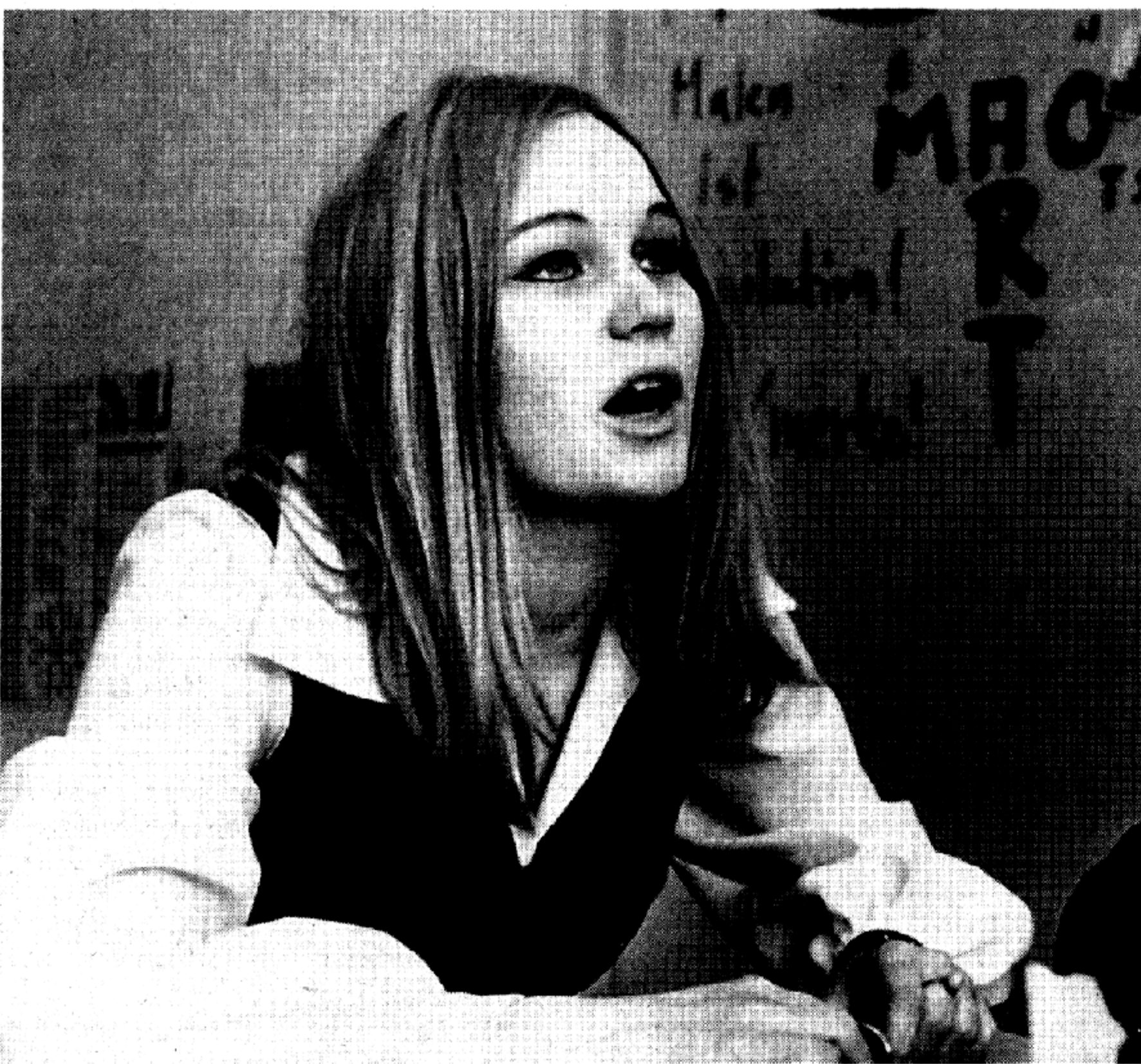
Brigitte Mohnhaupt vor ihrer Verhaftung 1972