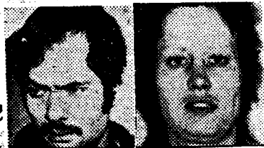
★ Andreas Baader ★ Ulrike Meinhof